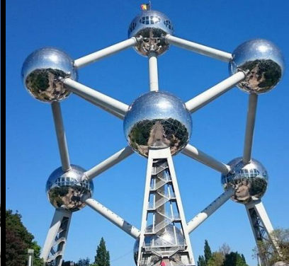
L'Atomium A Bruxelles en Belgique