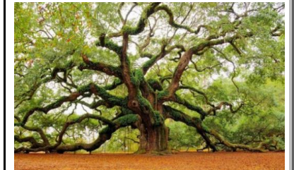
Le chêne Ange (1400 ans)