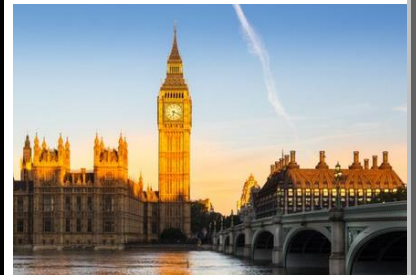
Big Ben A Londres en Angleterre

Des idées de structures originales ou lieux particuliers