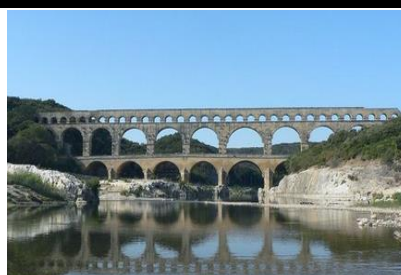
Pont du Gard France