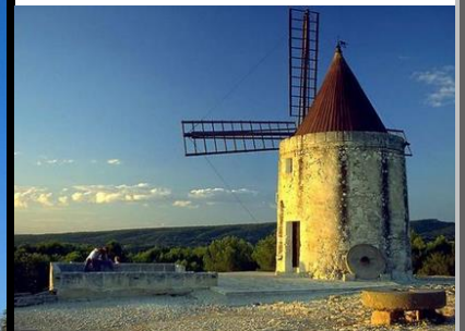
Moulin de Daudet A Fontvieille en France