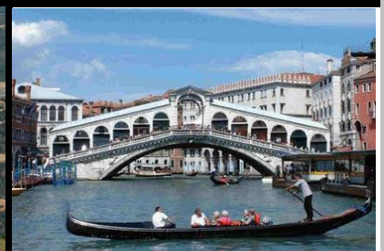
Pont de Rialto A Venise en Italie