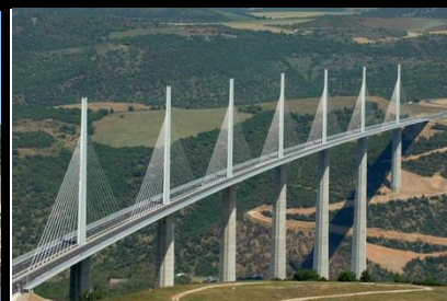
Viaduc de Millau En France