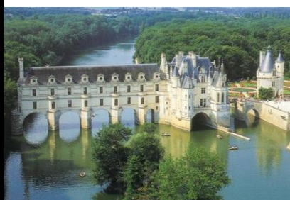
Château de Chenonceau Château de la Loire France