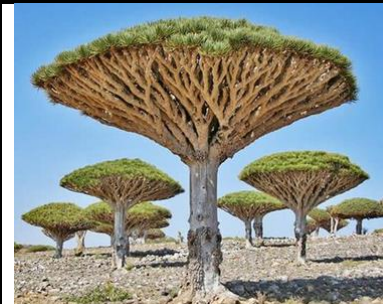
Dragonnier de Socotra