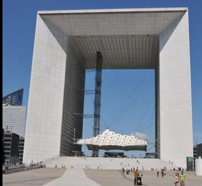
L'Arche de la Défense à Paris France

Des idées de structures originales ou lieux particuliers