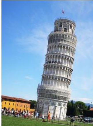
La Tour de Pise A Pise en Italie