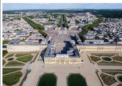
Château de Versailles A Versailles en France