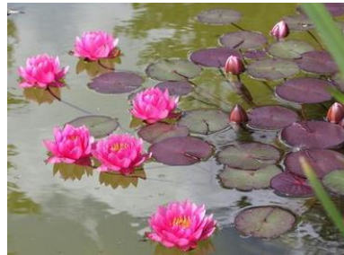
Fleurs de nénuphar