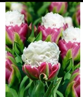
Tulipe Ice cream