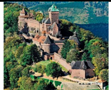
Château de Haut-Kœnigsbourg en France