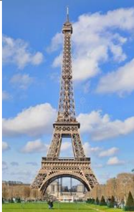
La Tour Eiffel A Paris en France